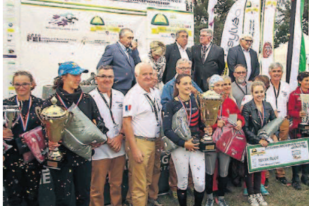
Des bénévoles de l'association posent avec les gagnantes.